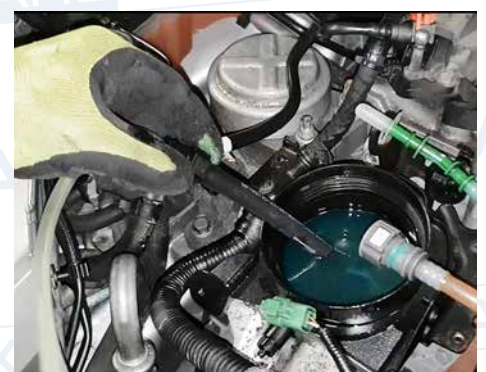
Entleeren von Filtergehäusen