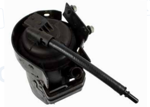
Kraftstofffilter für Opel / Fiat

Ein Großteil der Kraftstoffsysteme ist mit genormten SAE-Verbindungen ausgestattet.