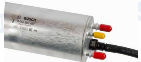
VW T5 Kraftstofffilter