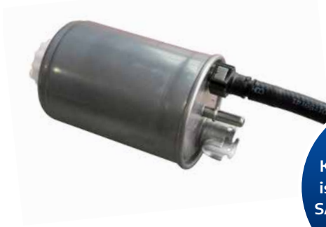
Kraftstofffilter im Metallgehäuse